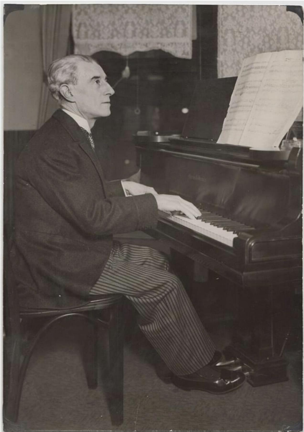
Maurice Ravel répétant sa Sonate pour violon et piano sur un piano Mason & Hamlin, Chicago, 21 janvier 1928