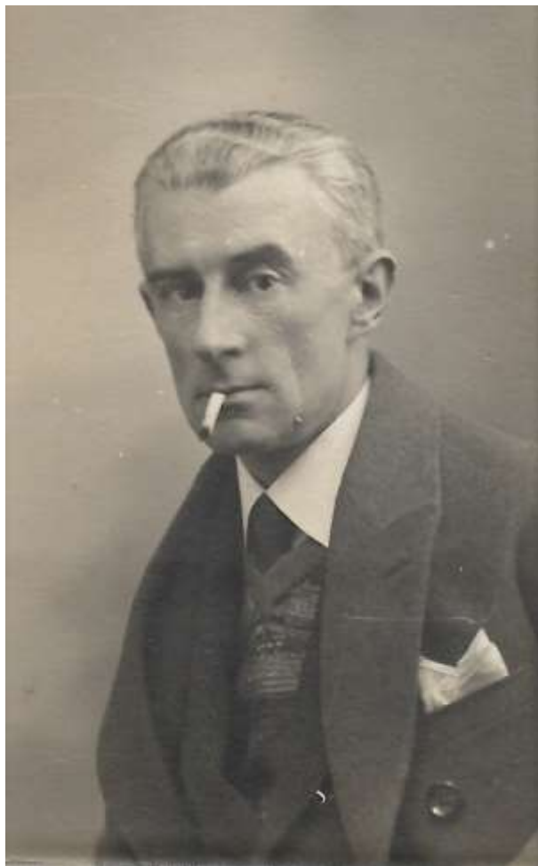
Maurice Ravel vers 1930-1932